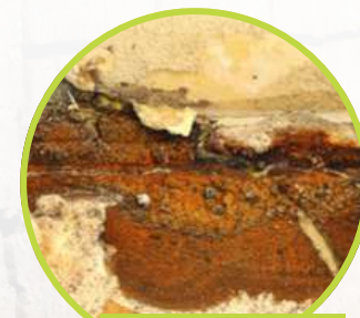
Mérule pleureuse (Serpula Lacriman)